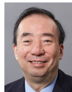
清家 篤 慶應義塾長