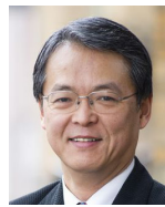
添谷芳秀 慶應義塾大学法学部 教授