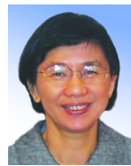
タン・シュー・ヤン マレーシア大学 IKMAS経済学教授