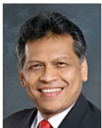
スリン・ピッツワン 前ASEAN事務局長

本シンポジウムでは、政策提言「2015年を超えて:東南アジアの平和・安定・繁栄のための日本・ASEAN戦略的パートナーシップ」に基づき、日本とASEANが戦略的なパートナーシップの下、2015年以降も、いかにASEANの地域共同体の構築を推進しうるか、経済、政治・安全保障、社会・文化の3つの共同体ごとに検討します。