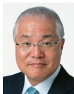
武見敬三 参議院議員